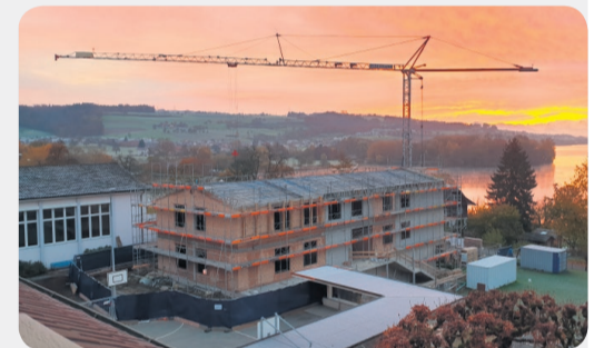
14.11.2019 Fertigstellung Rohbau