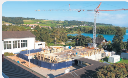
19.9.2019 Rohbau EG