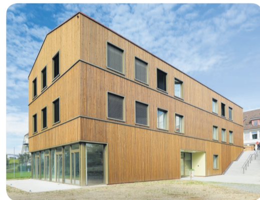
Schule und Wohnen MARIAZELL

Die Anforderungen, die der Neubau erfüllen soll, sind vielschichtig. Optimale räumliche Voraussetzungen für das pädagogische Schaffen stehen im Vordergrund.