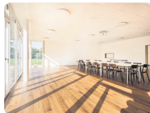
Mehrzweckraum im neuen Schulhaus integriert

Die multifunktionale Nutzung eines Mehrzweckraums, eine energiefreundliche Bauweise und nicht zuletzt auch ästhetische Ansprüche und zahlreiche baurechtliche Aspekte gilt es zu berücksichtigen.